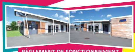
RÈGLEMENT DE FONCTIONNEMENT